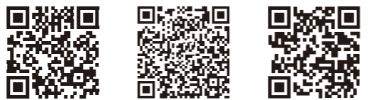
爱普生官方网站 爱普生官方微信 爱普生官方微博

图片仅供参考, 外观以实物为准。本说明若有任何细节之更改, 恕不另行通知。 爱普生 (中国) 有限公司在法律许可的范围内对以上内容有解释权。